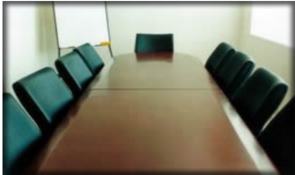
SALA DE JUNTAS P/10 o 12 PERSONAS